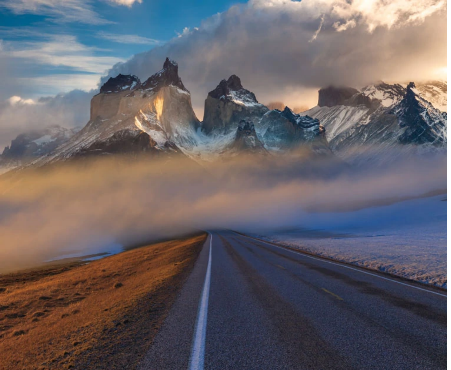
Parc Torres del Paine