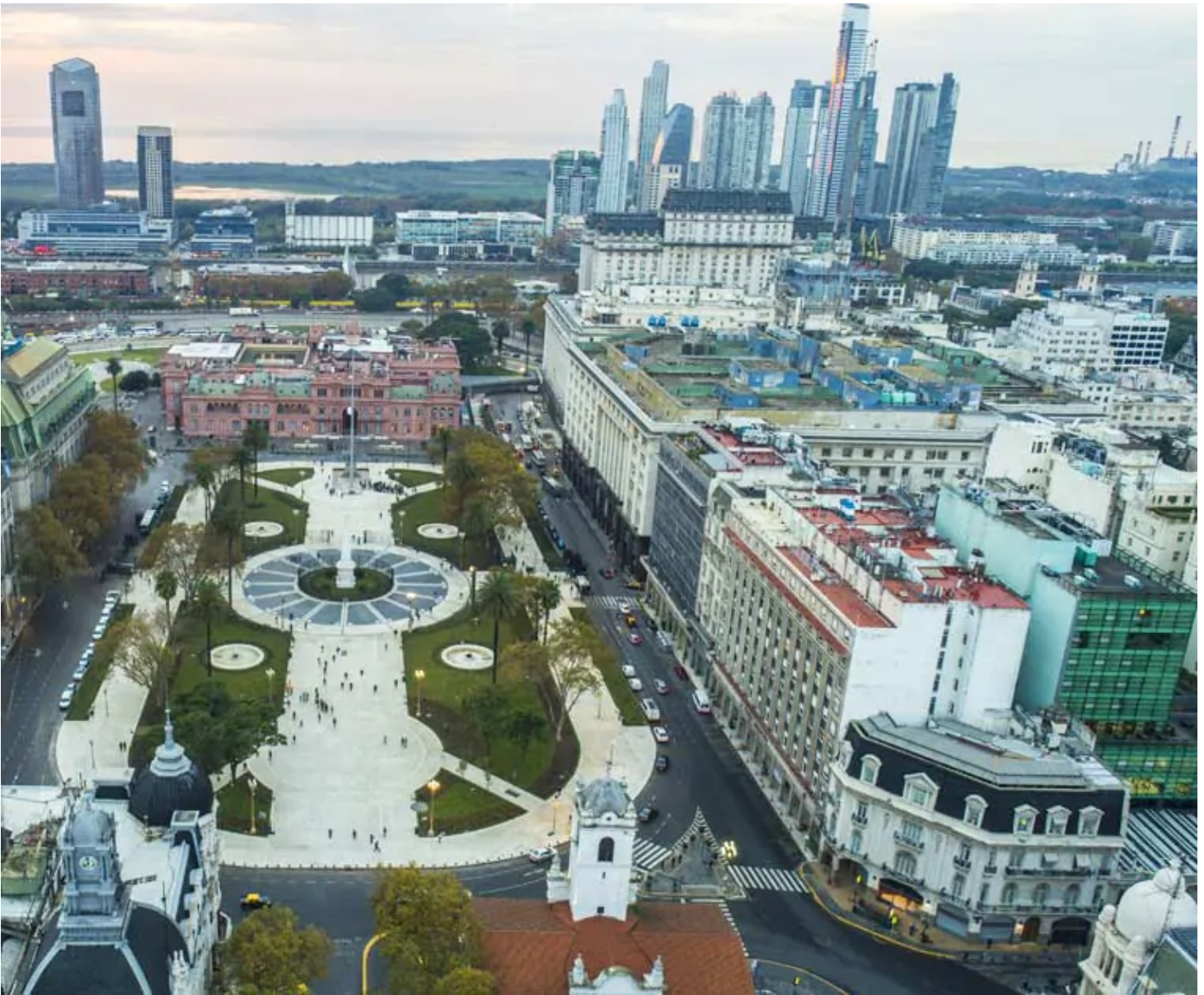
Plaza de Mayo