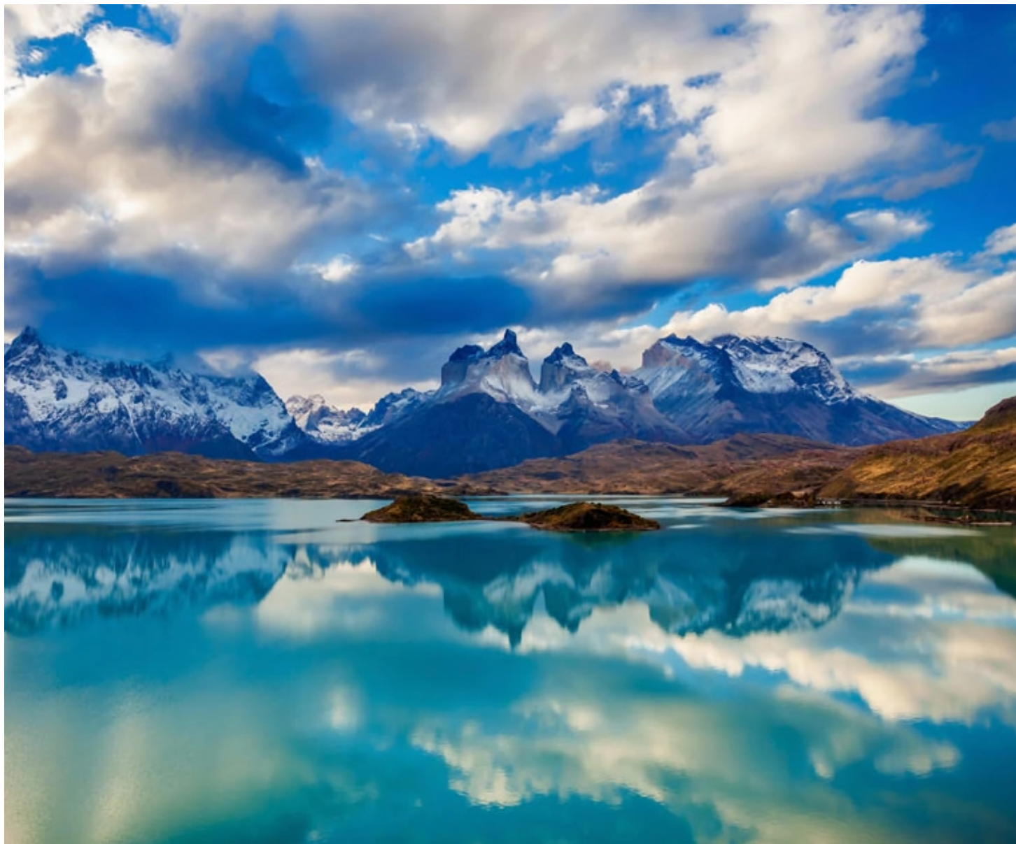
Parc Torres del Paine