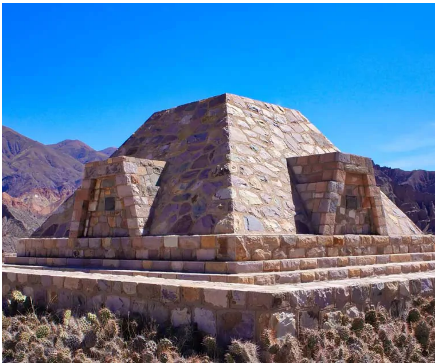
Ruines de Tilcara