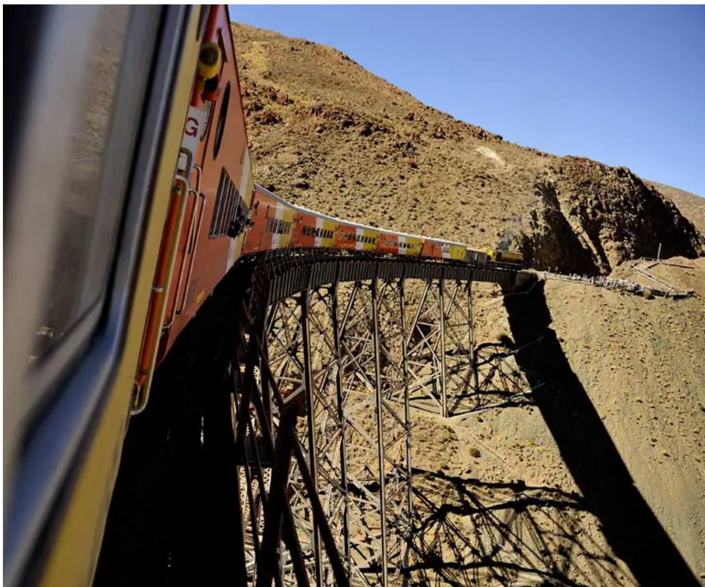
Tren a las Nubes