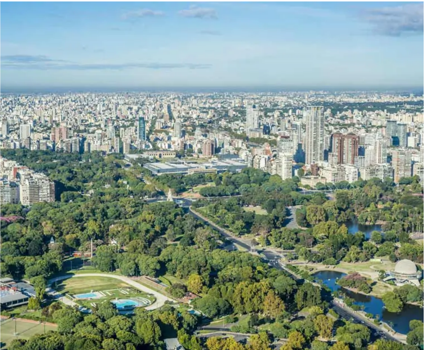
Jardins de Palermo