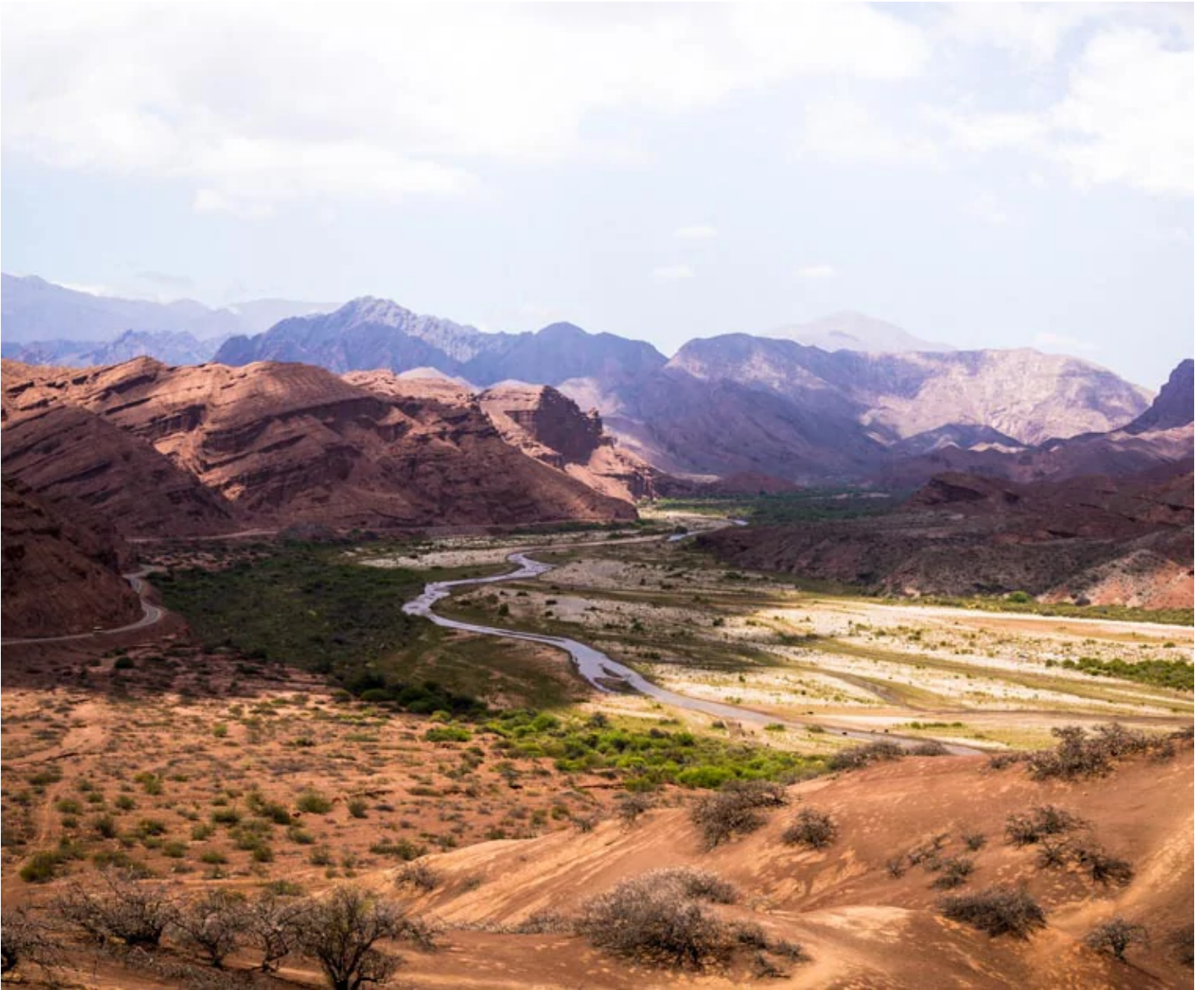
Quebrada de las Conchas