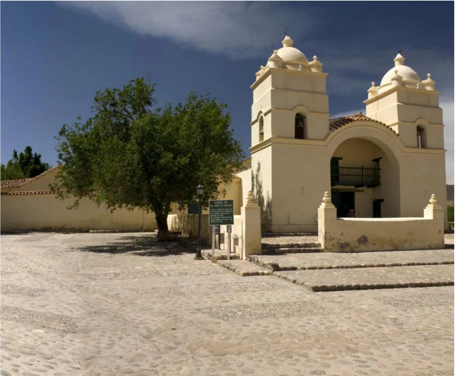
Eglise de Cachi