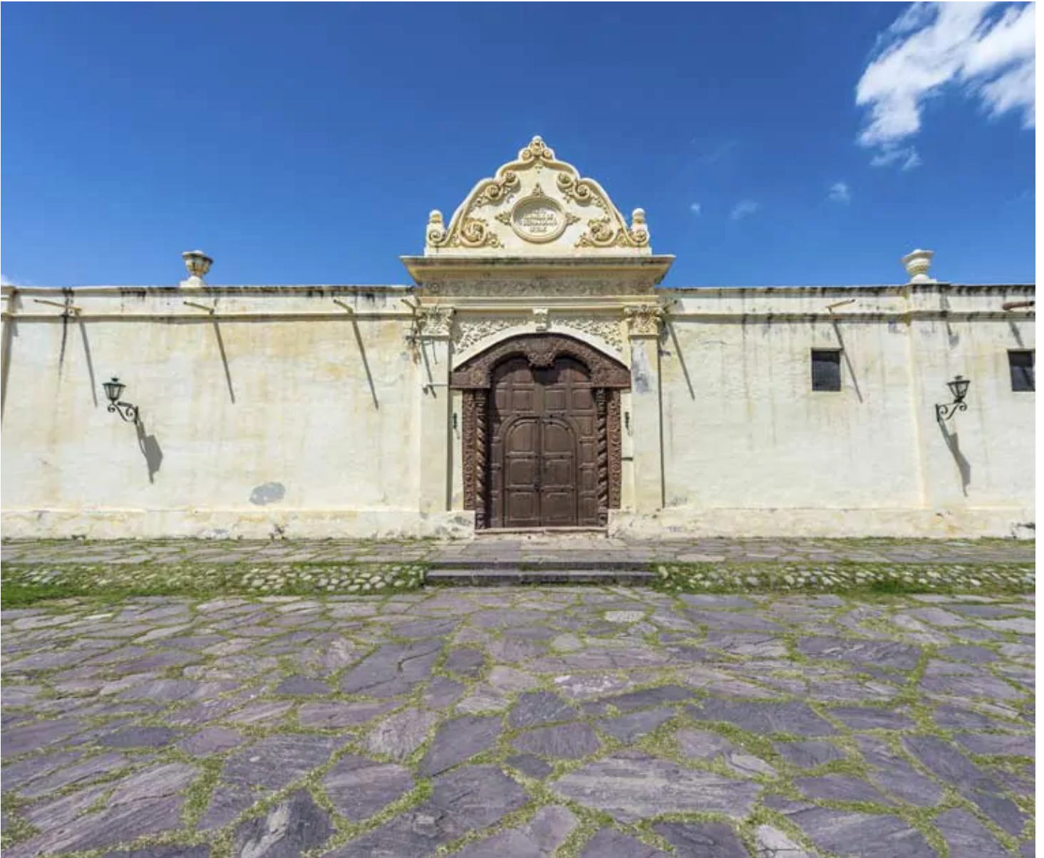
Couvent de San Bernardo