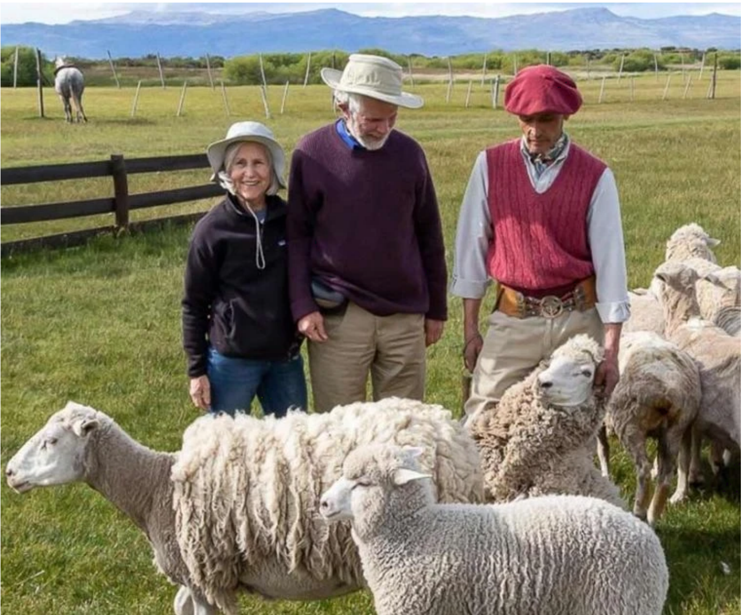
Estancia de moutons