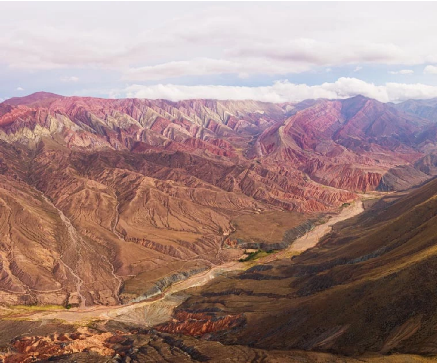
Serrania del Hornocal