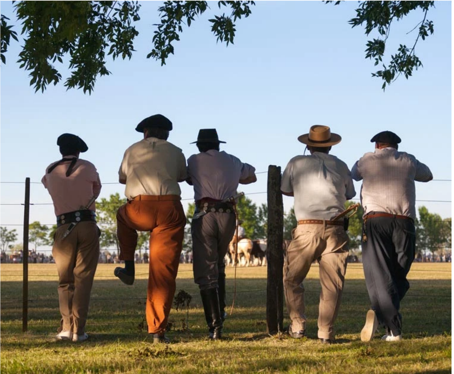
Gauchos de la pampa