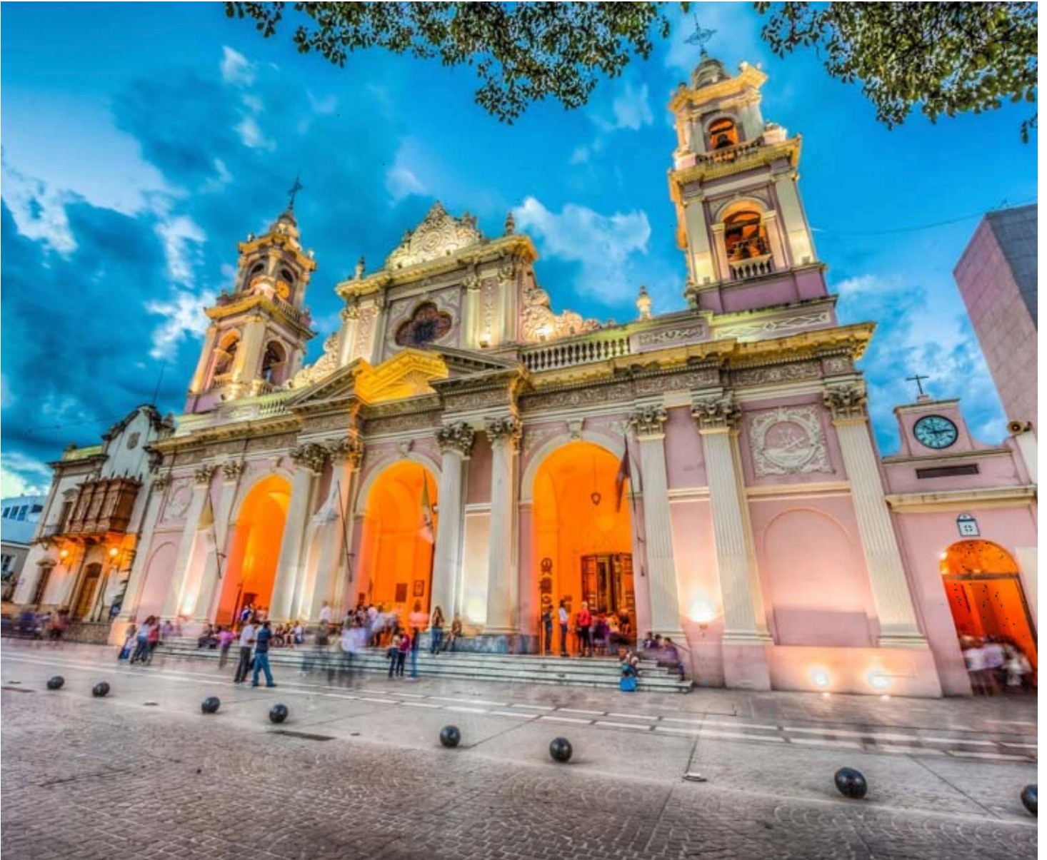
Cathédrale de Salta