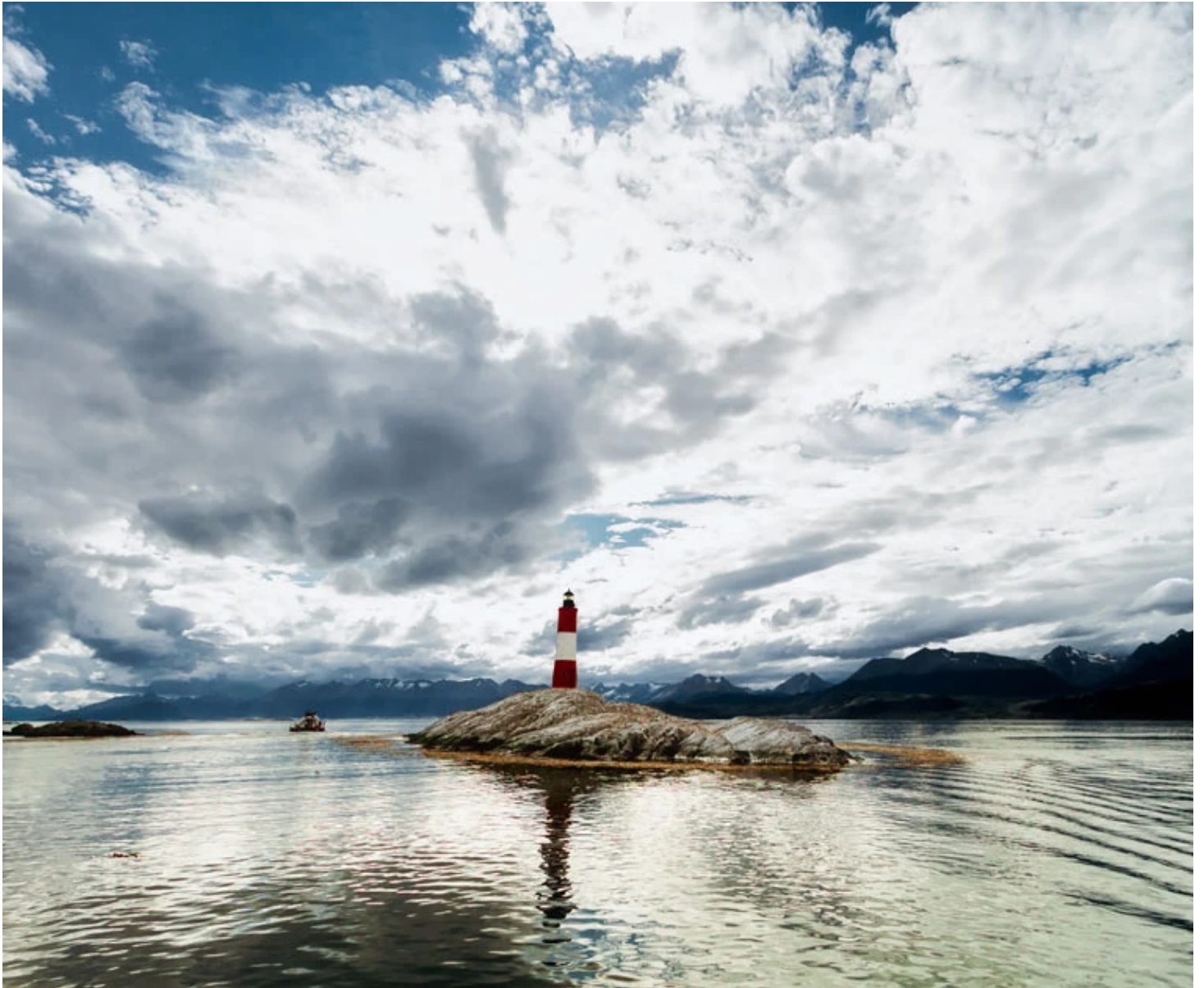
Canal de Beagle