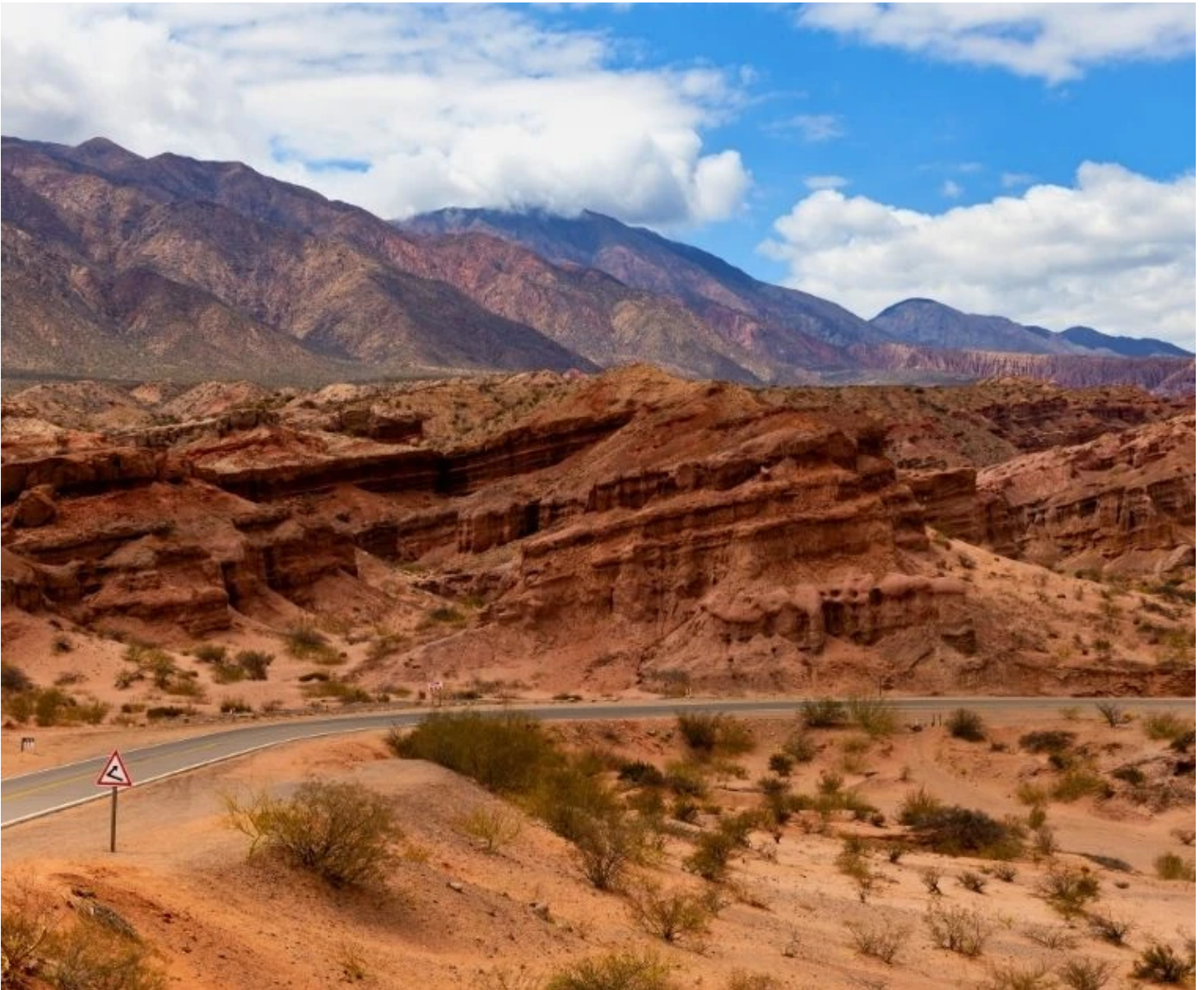
Quebrada de las Conchas