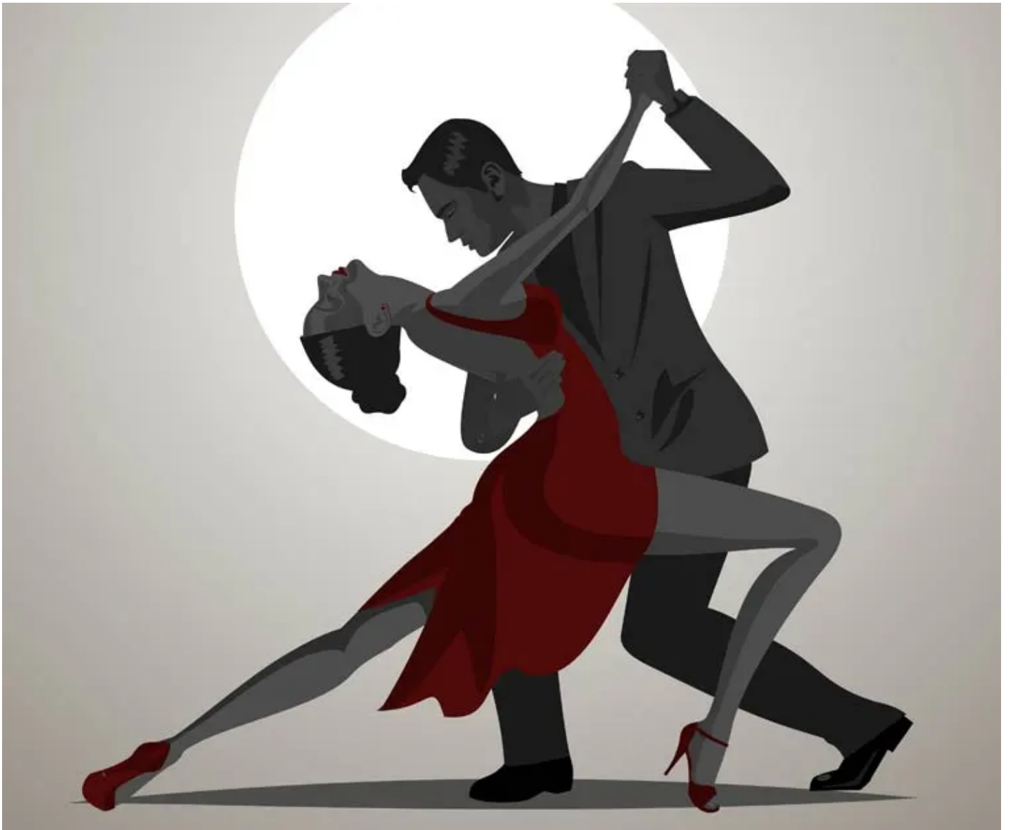
Illustration de Tango