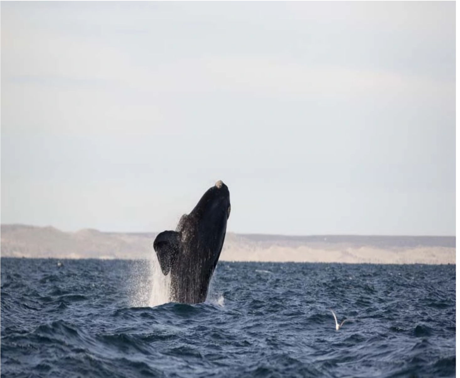
Baleine de Valdès