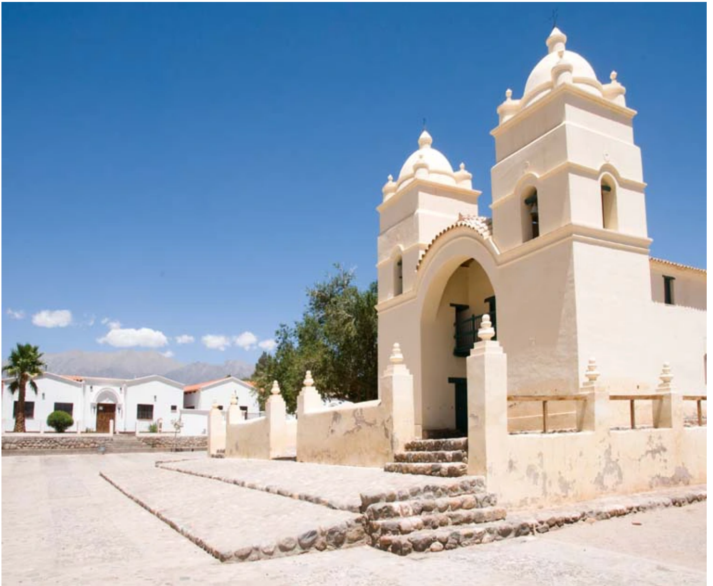
Église San Pedro