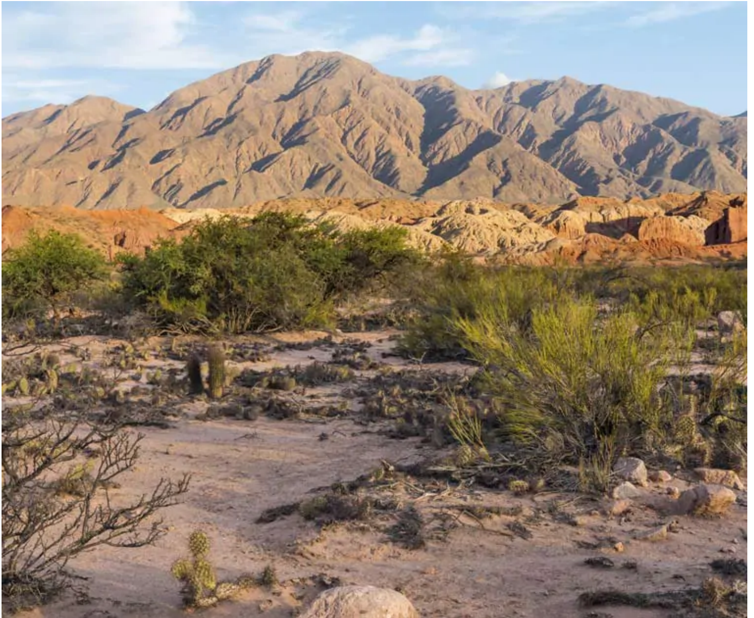
Canyon de Las Conchas