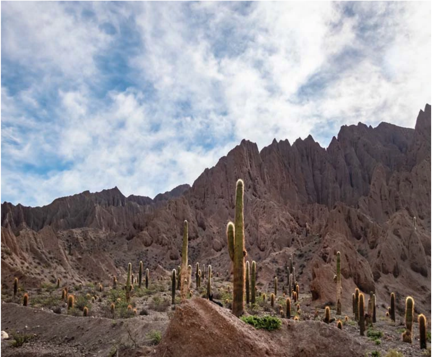
Quebrada del Toro