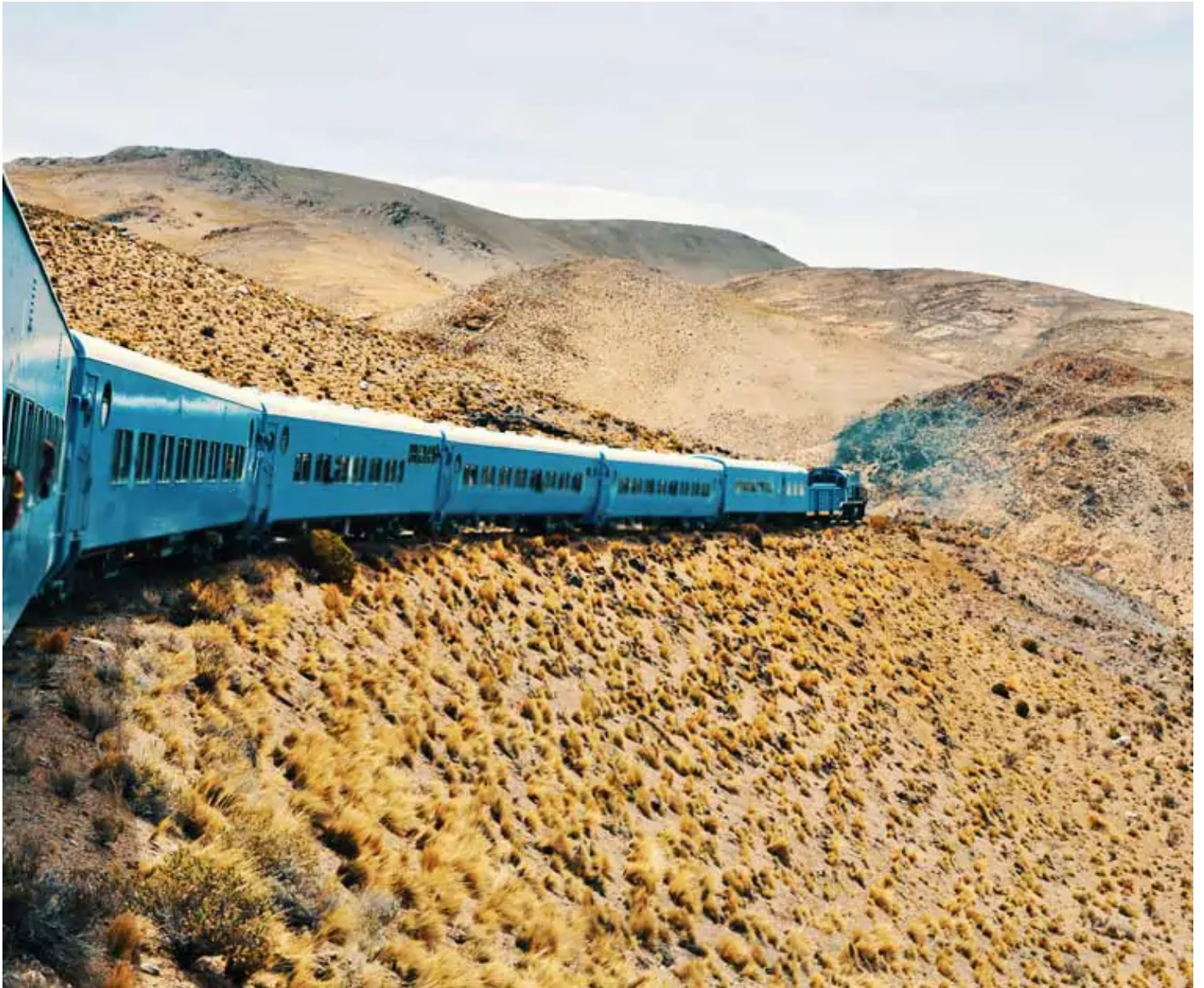
Tren a las Nubes