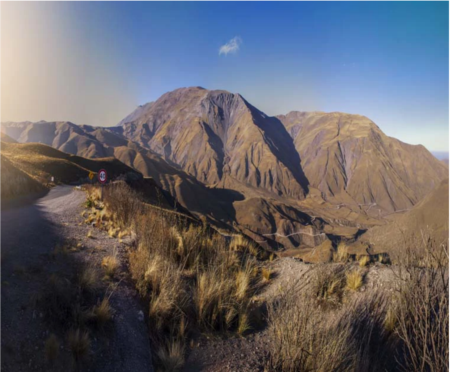
Cuesta del Obispo