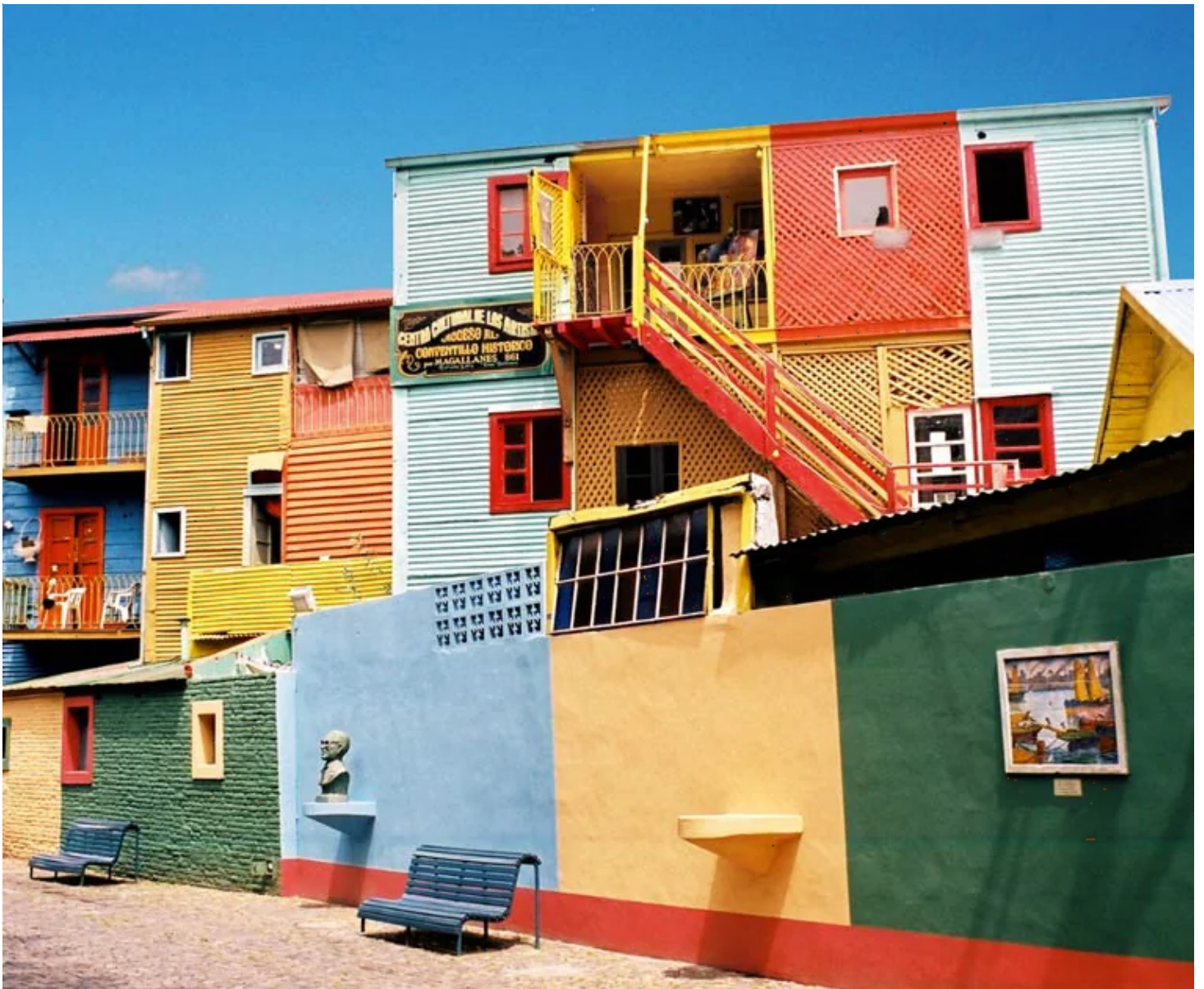
Quartier de La Boca