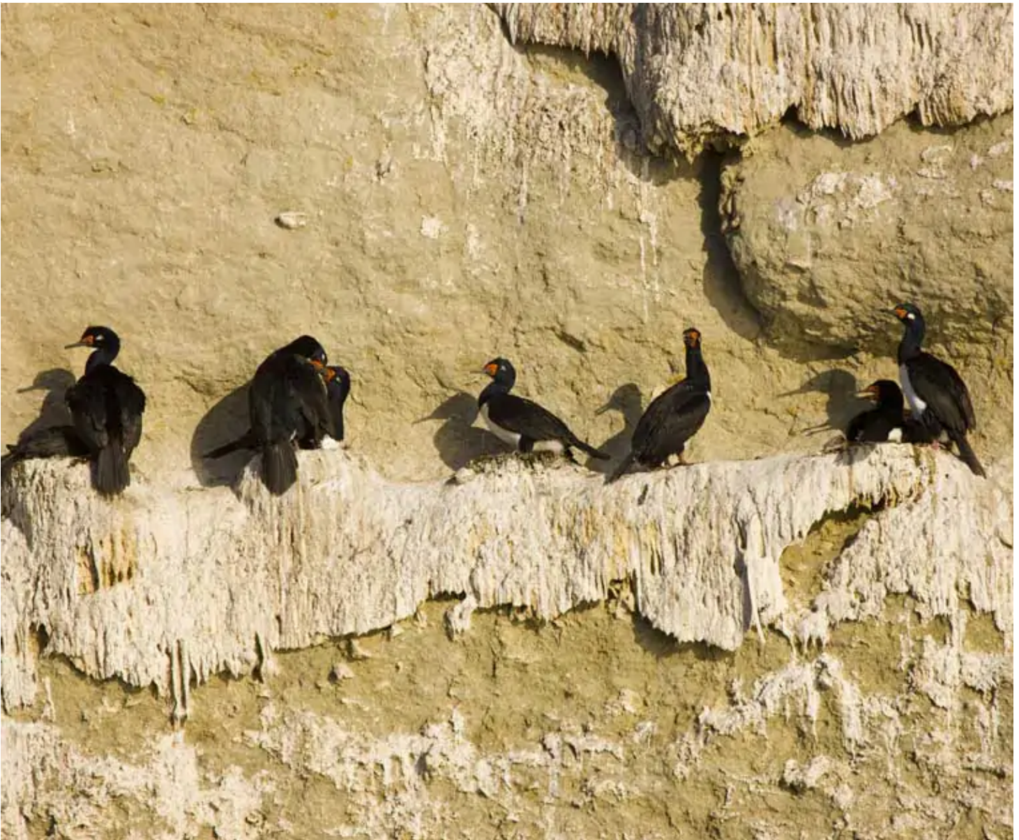
Cormorans de Valdés