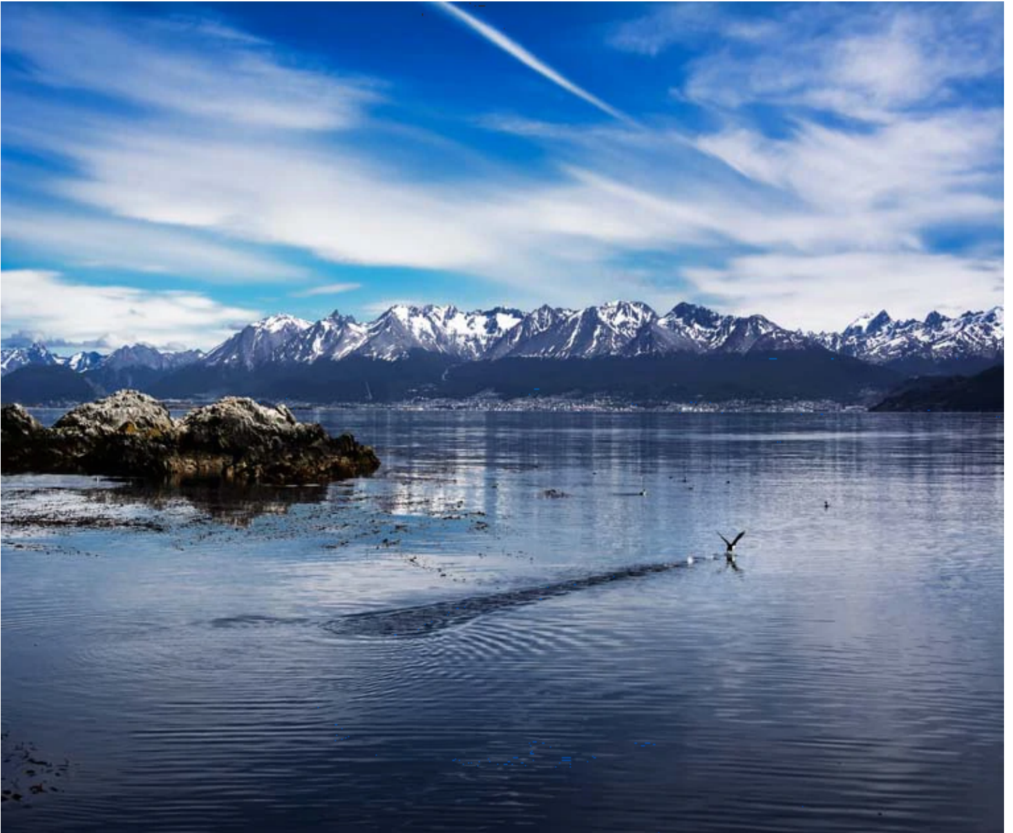
Canal de Beagle