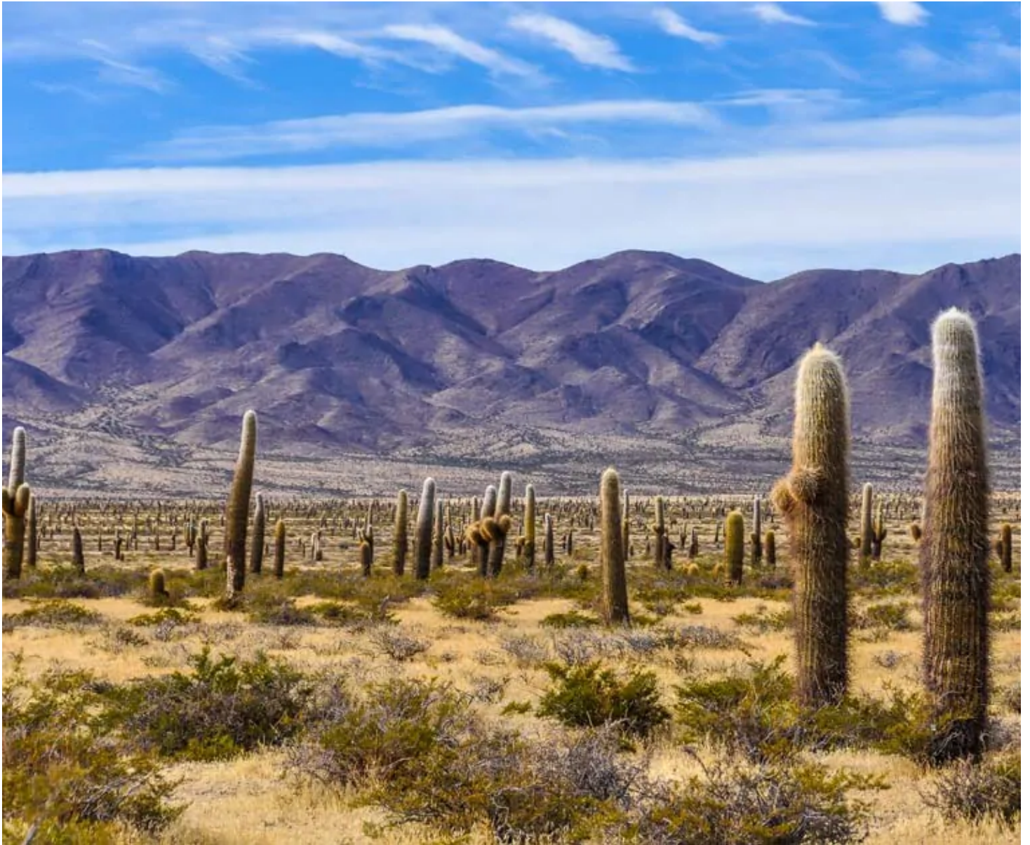
Parc Los Cardones