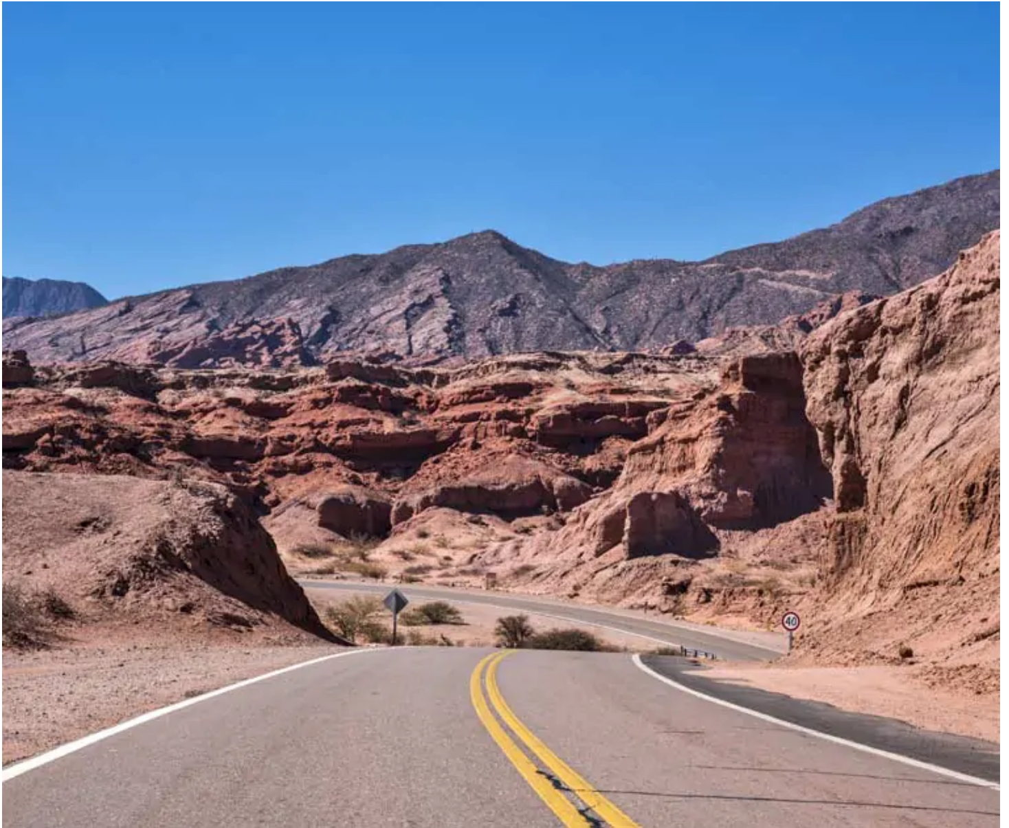
Canyon de Las Conchas