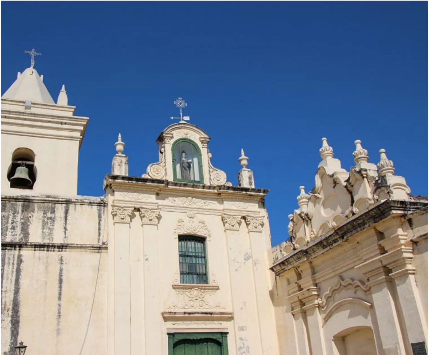
Couvent de San Bernardo