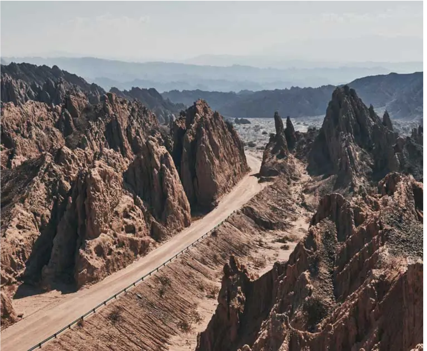
Quebrada de las Flechas