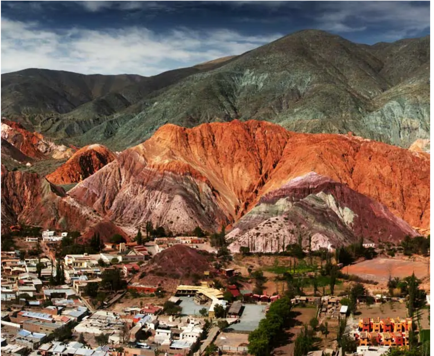
Quebrada de Humahuaca