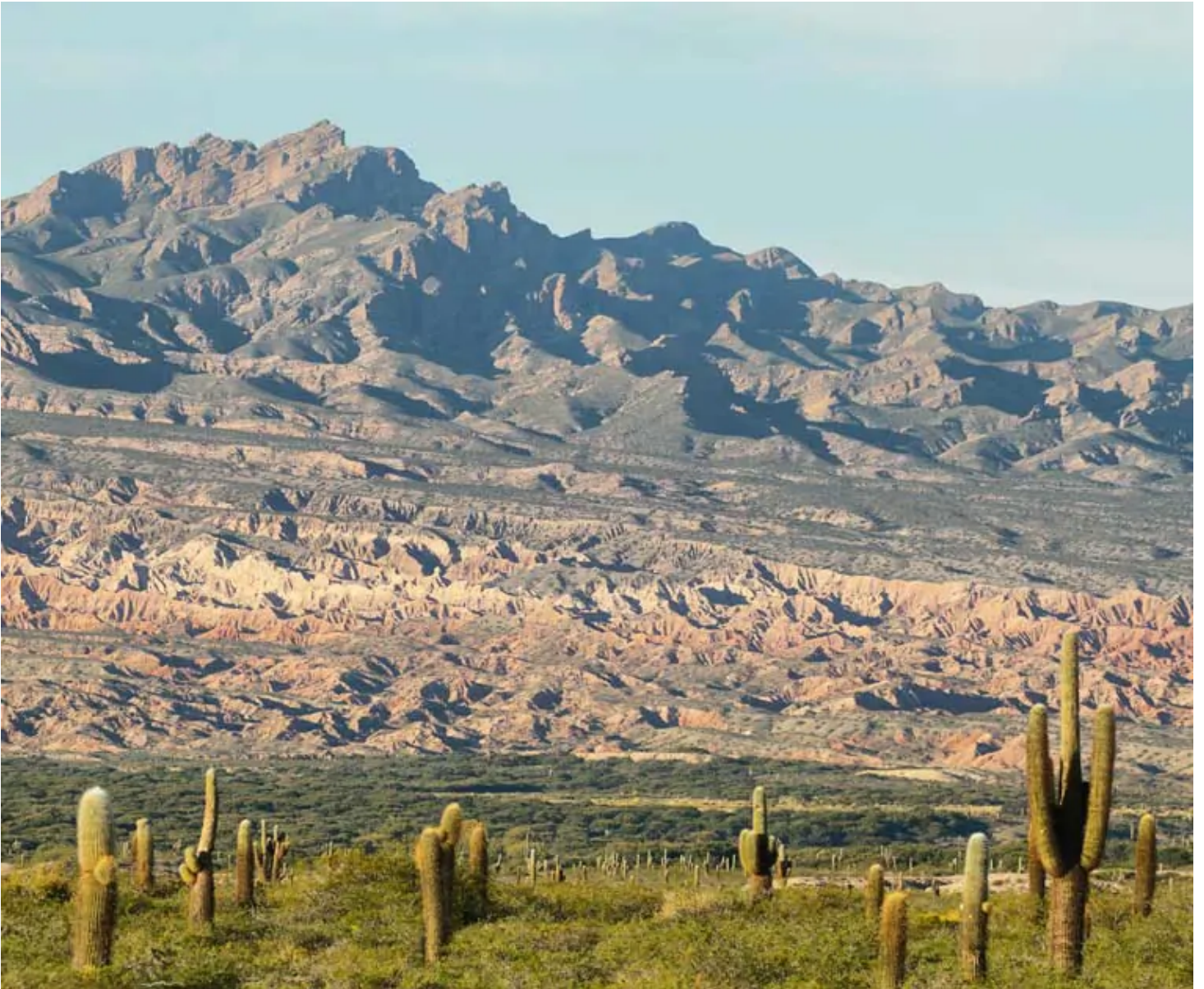
Parc Los Cardones