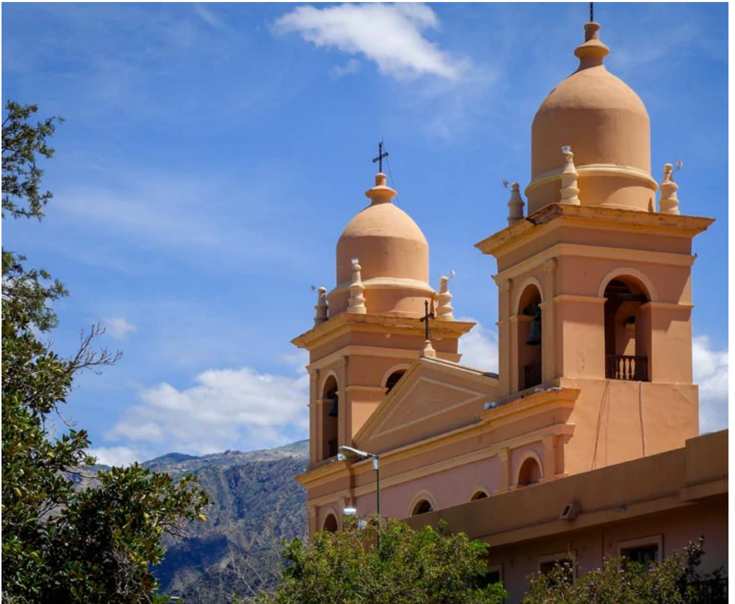
Cathédrale de Cafayate