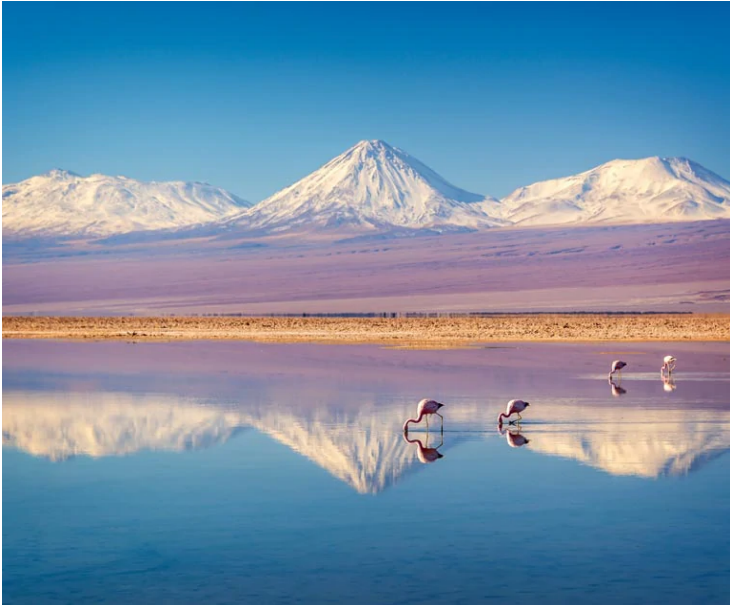
Laguna Chaxa au Salar de Atacama