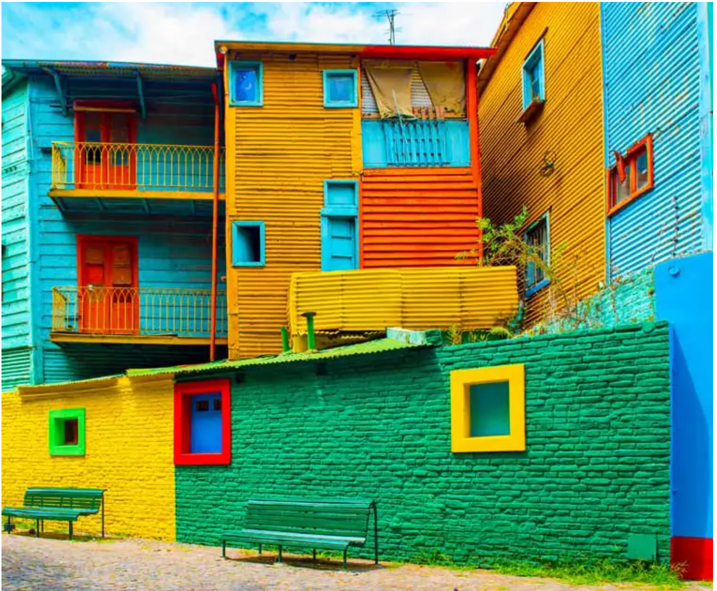
Quartier de La Boca