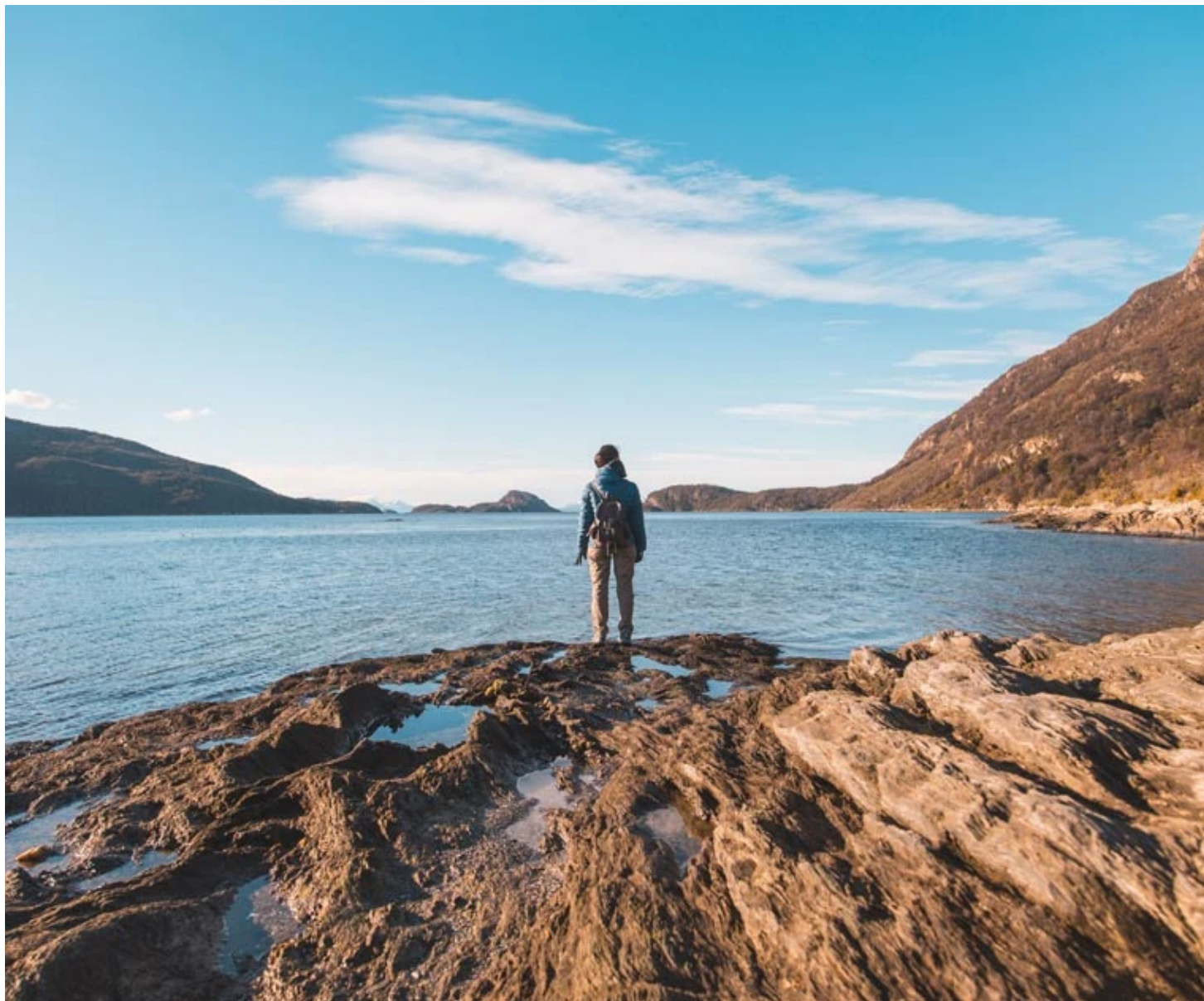
Parc Tierra del Fuego