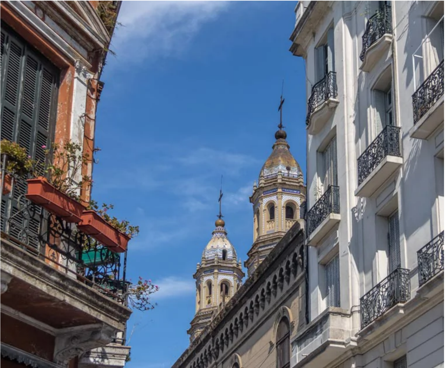
Quartier de San Telmo