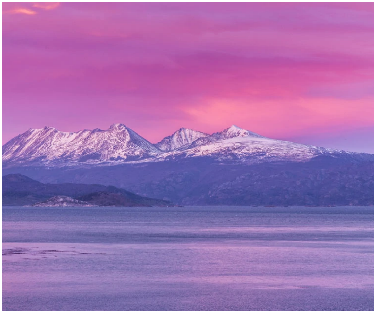
Canal de Beagle