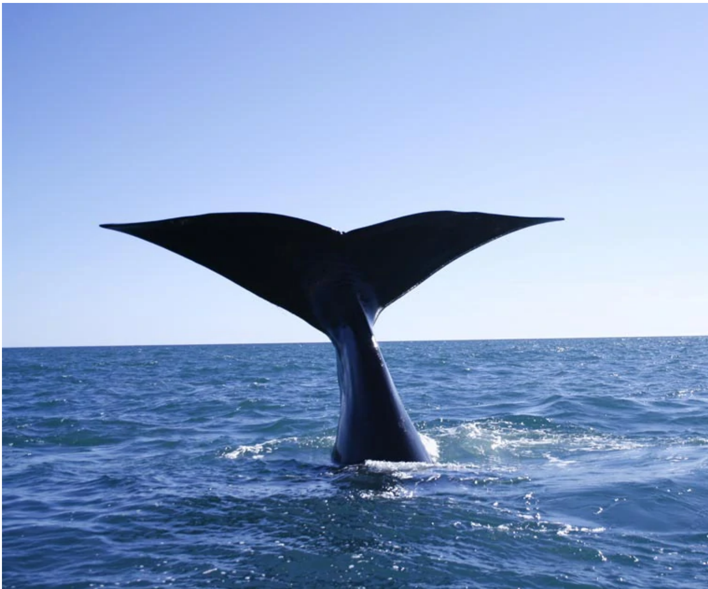
Péninsule de Valdès