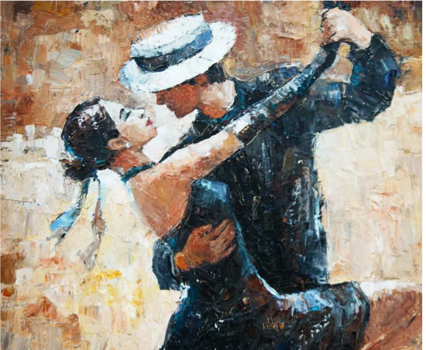
Danseurs de tango